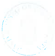
Asztalos István polgármester